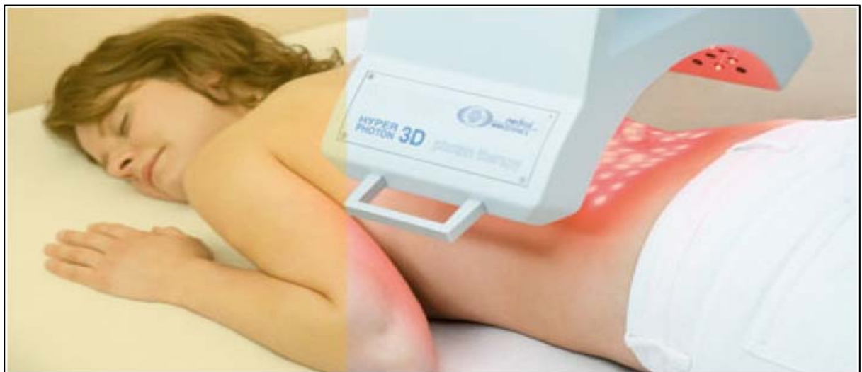
Behandeling met de Hyperphoton 3D