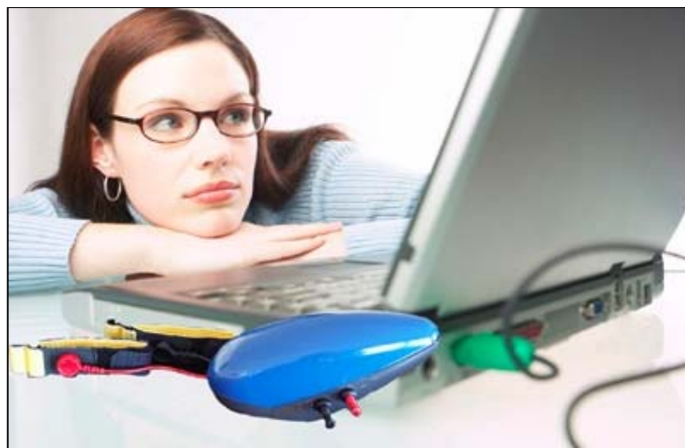
Zapper met zapelektroden

De behandeling bestaat uit 3 basis EDA metingen waarna 2 zapelektrodes op het lichaam geplakt worden, gevolgd door 3 x 7 minuten zappen met de bepaalde frequenties met 10 minuten pauze ertussen. De behandeling wordt afgerond met een EDA meting. De totale behandeling duurt ca. 50 minuten.